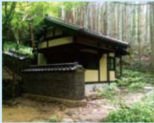
旧風呂場跡（東屋に改修）