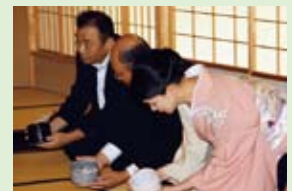
茶わんを拝見する参加者たち