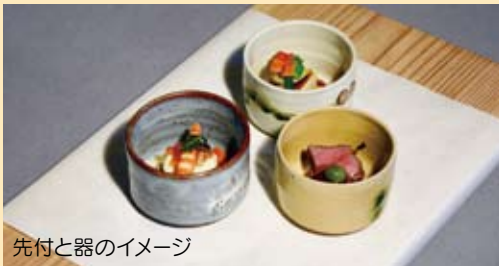
先付と器のイメージ

広見の日本料理店「おりべ亭」を経営。独学で料理を学び、3代続く料理旅館を継ぐ。食材や旬にこだわったメニューが好評。限られた器に彩られる「創作三宅流料理」をご堪能ください。